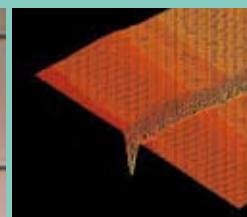
製品断面の3次元画像