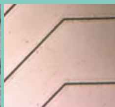
巾 10 μm 高さ 10 μm のラインを形成した微細金型