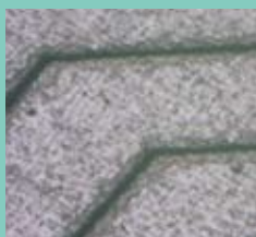
汎用樹脂へのパターン転写