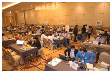
2020年FBCバンコクウェブ商談会の様子